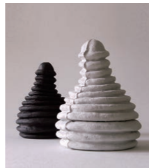
moco W13 D12 H17cm