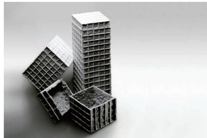
Mold Packo B 箱大: W12 D12 H32cm 箱中: W12 D12 H18cm 箱小: W12 D12 H11cm