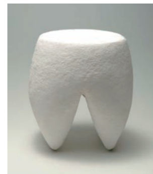
Kirikabu W40 D40 H43cm