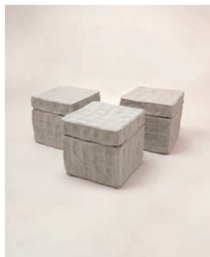
Fragile A W12 D12 H12cm