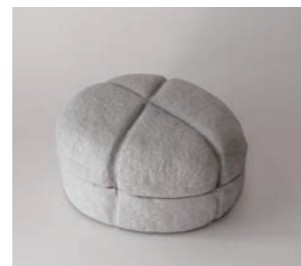
Rabbit W20 D18 H9cm