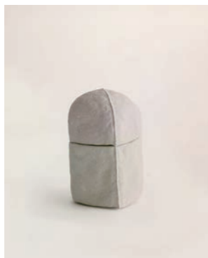
Fragile B W7 D7 H14cm