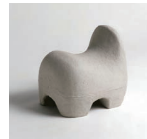
Voice W37 D48 H49cm