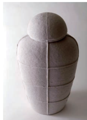
Bishop W25 D18 H48cm