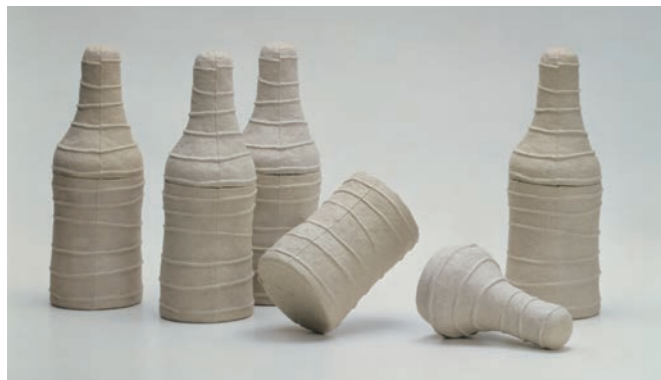
Mold Packo A W12 D12 H33cm