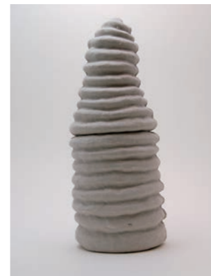
moco moco W13 D13 H32cm