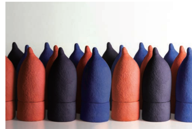
MOLDOMPÉRI W16 D14 H41cm color: red / black / blue