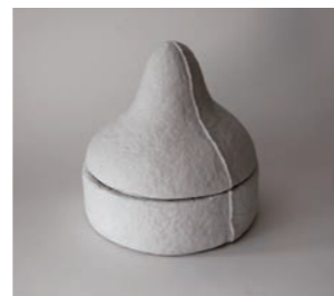
Pao W21 D21 H21cm