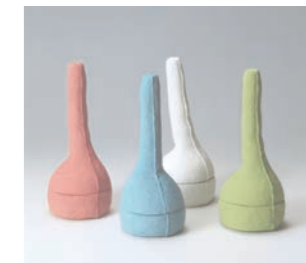
Flamingo W12 D12 H30cm color: red / green / white / blue